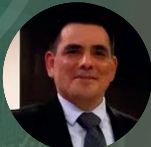
DR. VICENTE CRUZATE CABREJO

Despacho Viceministerial de Salud Pública del Ministerio de Salud.